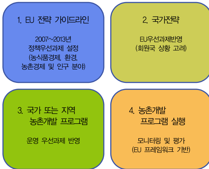
그림 2 EU 농촌개발정책 프레임워크

부 프로그램, 특정 국가 및 지역의 필요에 따른 개별적 농촌개발조치 등이 명시된다.