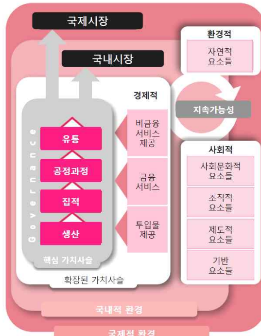
그림 1. FAO의 지속가능한 농식품 가치사슬(SFVC)