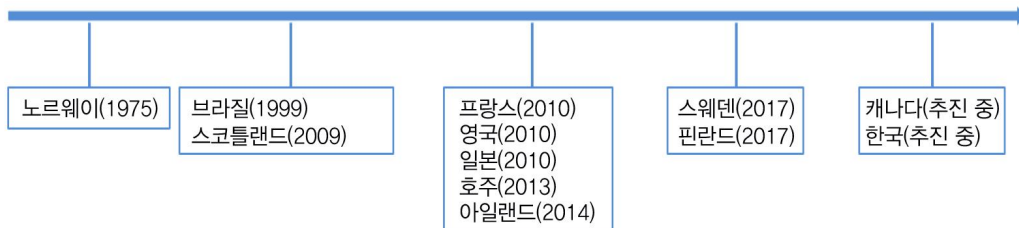
<그림 2> 국내외 국가 푸드플랜 수립 동향

우리나라를 포함한 세계 각국에서는 푸드시스템 전반에 대한 체계적이며 지속가능한 대응을 위하여 국가 푸드플랜을 수립·추진해 왔다. 본고는 향후 수립·추진될 예정인 우리나라 국가 푸드플랜에 대한 시사점을 얻고 관련 이해당사자들의 이해를 돕기 위해 해외 주요 국가의 국가 푸드플랜 수립 현황과 국가 푸드플랜에 포함된 주요 내용을 비교·검토하였다. 수립과정에 있어 다소 아쉬운 부분이 있으나 중요한 시사점을 도출할 수 있는 국가인 프랑스, 호주, 영국의 국가 푸드플랜을 중심으로 시사점을 도출하였다.