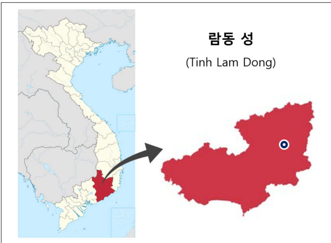
〈그림 3-1〉 사업대상지(람동 성) 위치